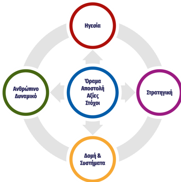
The 5CPF® Model

Το 5CPF® Model εκφράζει τη σύγχρονη αντίληψη ότι, η βελτίωση της απόδοσης μιας επιχείρησης ή ενός τμήματός της, απαιτεί την εναρμόνιση και ισορροπία των 5 κρίσιμων παραγόντων απόδοσης.